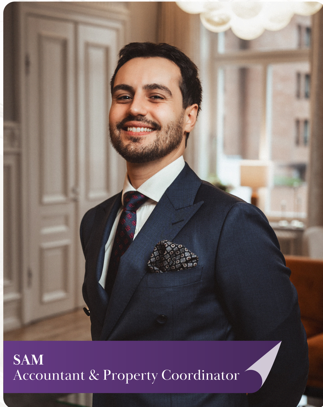
SAM Accountant & Property Coordinator