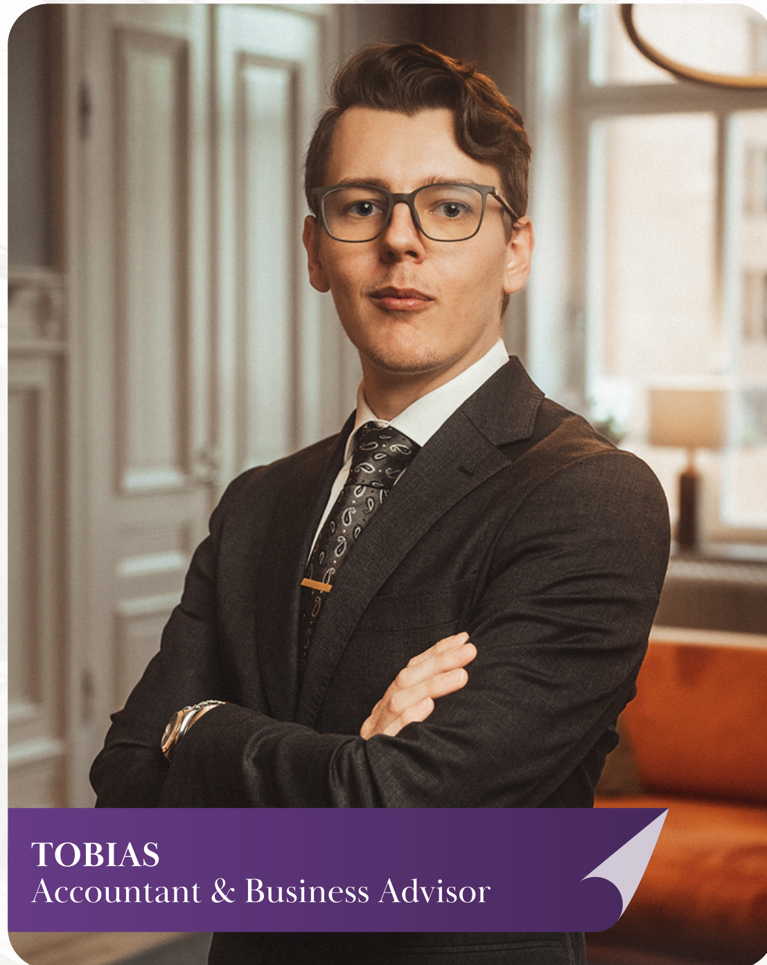
TOBIAS Accountant & Business Advisor